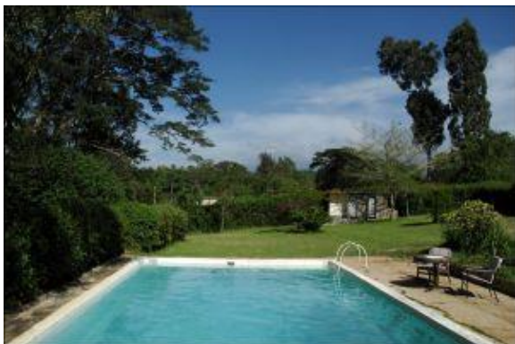
Udsigt til Kilimanjaro