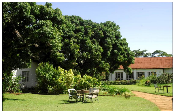
Haven på Marangu Hotel